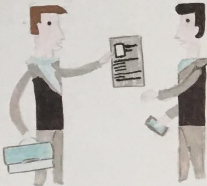
Arbeitslosenrate in Rumänien